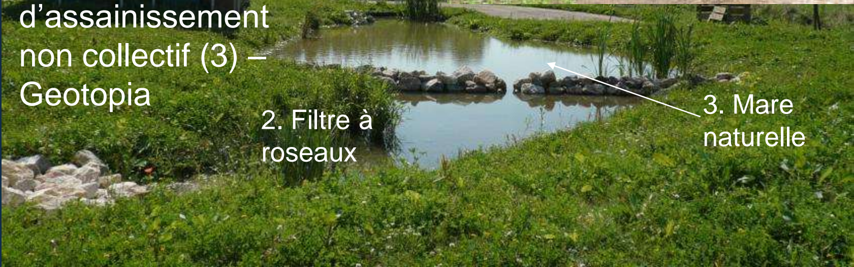
2. Filtre à roseaux