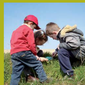
A la découverte des insectes.

GEOTOPIA est aussi le site idéal ouvert aux spécialistes et aux associations agissant dans tous les domaines de l'écologie et de l'environnement. Ils y trouveront les équipements et les ressources documentaires pour créer et développer leurs actions et leurs projets.