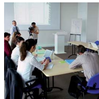
Lieu d'échanges, d'éducation et de partage d'expériences