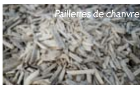
Paillettes de chanvre