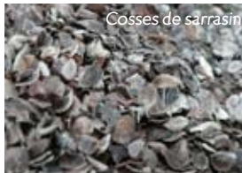
Cosses de sarrasin