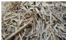
Paillettes de lin